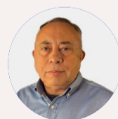
Idealizado por Juedir Teixeira

“O varejo é um negócio em que o comerciante precisa entregar experiência e produto tanto quanto o político tem de fazer, só que é todos os dias”, encerrou Teixeira.