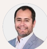
Idealizado por Fábio Vasconcellos